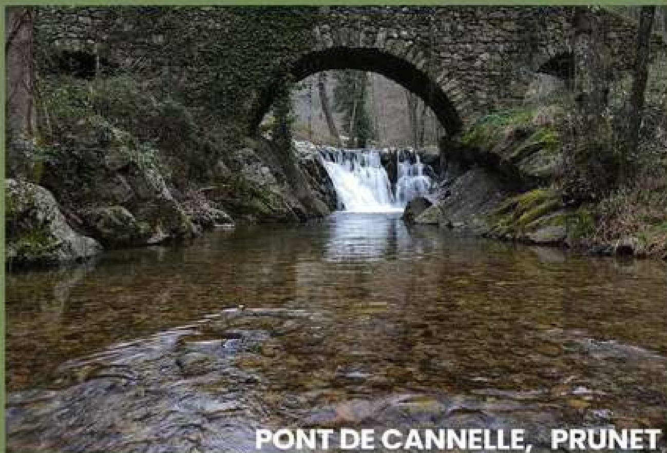
PONT DE CANNELLE, PRUNET